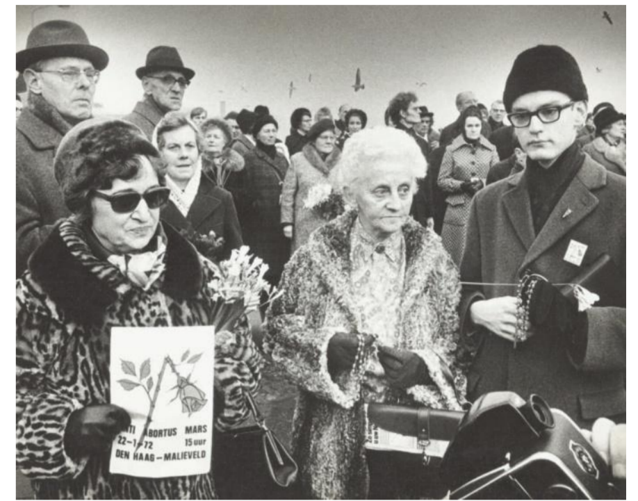
Anti-abortusdemonstratie, Den Haag, 1972.