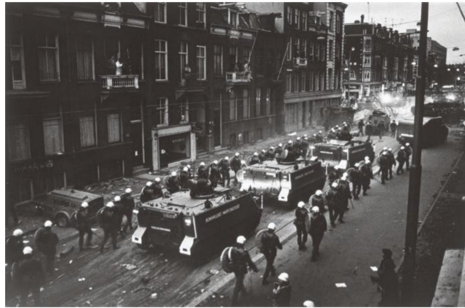
De slag bij de Vondelstraat, Amsterdam, 1982.

Willem Diepraam, Ian Buruma: De ja- ren 70. De Arbeiderspers, 136 blz. €28,50