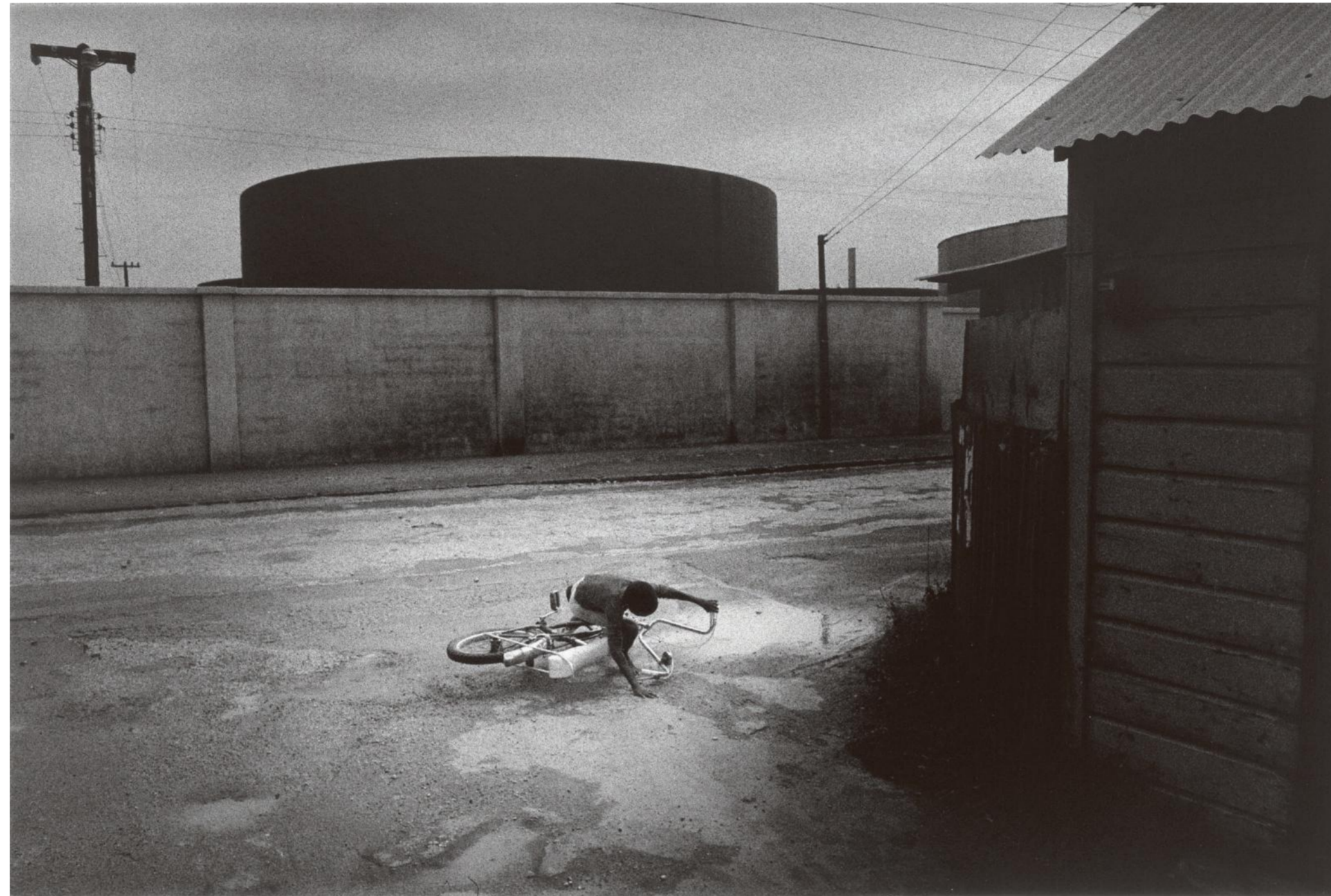
San Nicolas, Aruba, 1975.