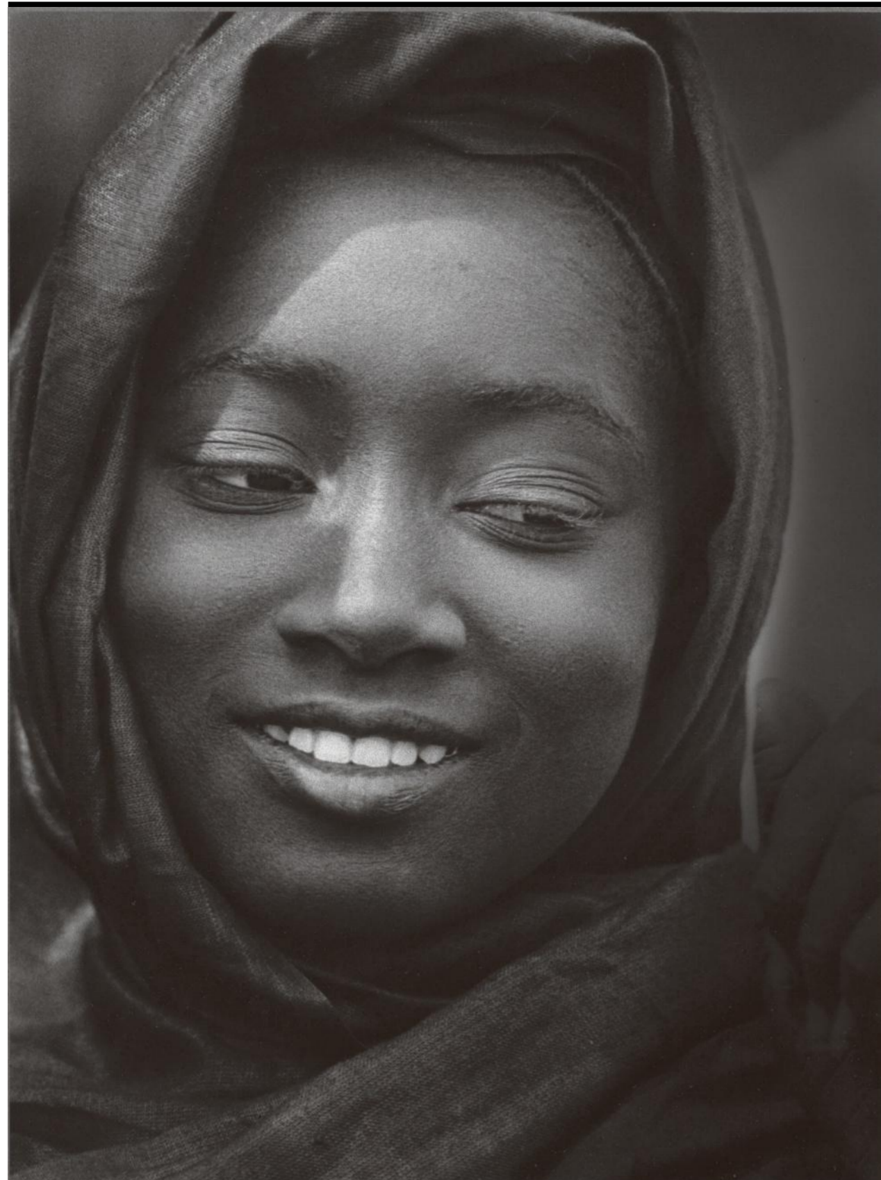
Burkina Faso, 1980.