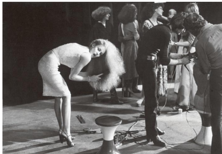
Jerry Hall, Parijs, 1975.