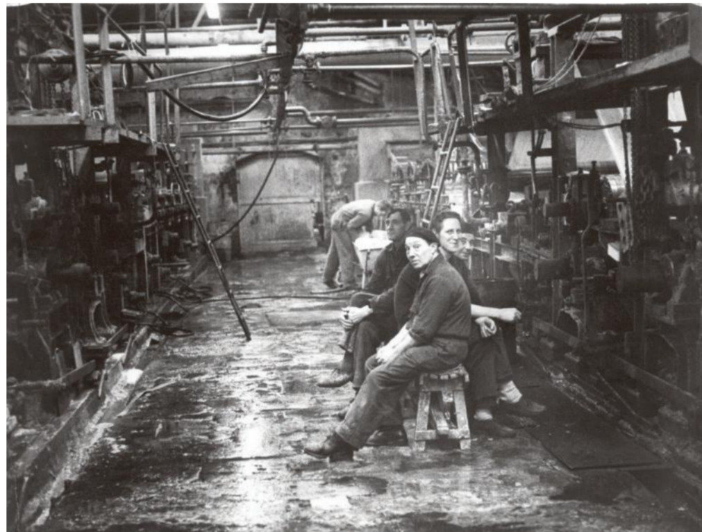
Strokkartonfabriek, Oost-Groningen, 1971.